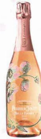
Cuvée Belle Époque 2010 Rosé Perrier-Jouët 340 €