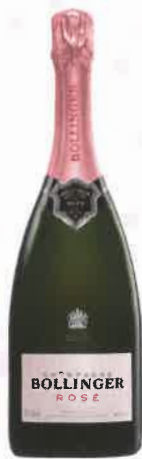
Bollinger Rosé Brut Bollinger 65 €