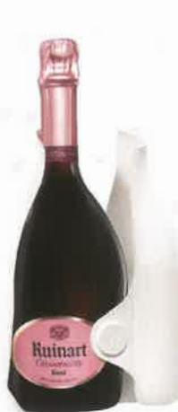
Cuvée Ruinart Rosé brut Ruinart 73 €