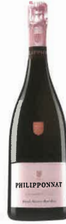
Cuvée Royale Réserve Rosé Philipponnat 48,90 €