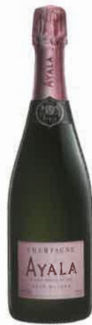
Rosé Majeur Ayala 42 €