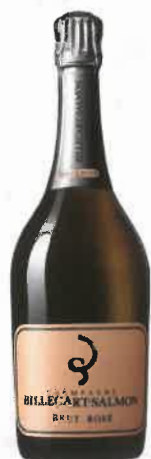
Brut Rosé Billecart Salmon 63 €

Chic, élégant et insolent, le champagne rosé se pare de bulles joyeuses en toutes circonstances. Ce grand vin de Champagne, longuement façonné, renferme un savoir-faire unique dans l'art de l'assemblage. De l'art à l'état pur, à déguster et à savourer avec modération.