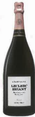
Rosé Extra Brut biodynamie Leclerc Briant 48 €