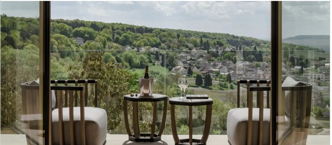
Vue sur les vignes au Royal Champagne.

Par Pascale Filiâtre , publié le 21 août 2020, 05:00