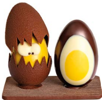
L'ŒUF POUSSIN de Mathieu Mocc pour La Grande Epicerie de Paris, 24,90 €