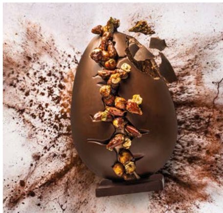
L'ŒUF EXPLOSION GOURMANDISE de Philippe Conticini pour les Galeries Lafayette Gourmet, 63 €