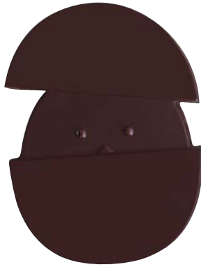
L'ŒUF INSERT PRALINÉ de Plaag, à partir de 25 €