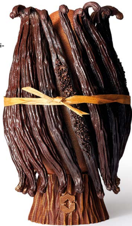
L'ŒUF VANILLE de Maxence Barbot pour le Shangri- La hôtel, 108 €