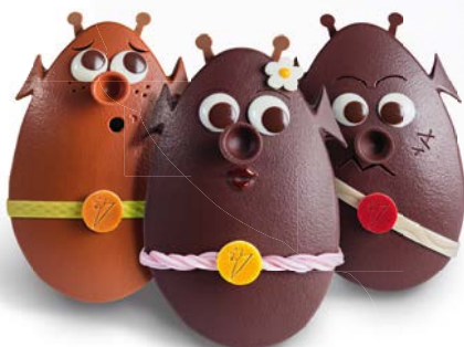
L'ÉQUIPAGE PASCAL de Nicolas Cloiseau pour la Maison du Chocolat, 35 € la pièce