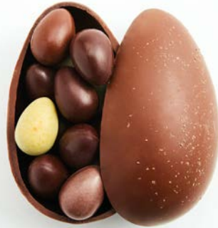
L'ŒUF XL de Pierre Marcolini, 25 €