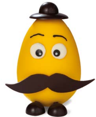
L'ŒUF GIGI de Pierre Chauvet, 15 €