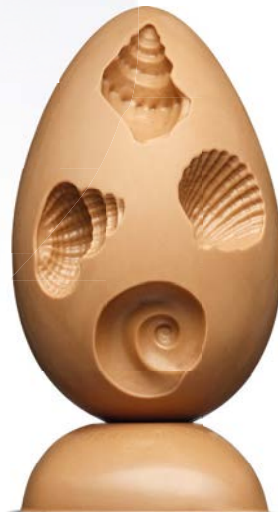
L'ŒUF POSÉIDON de Pierre Hermé, à partir de 43 €