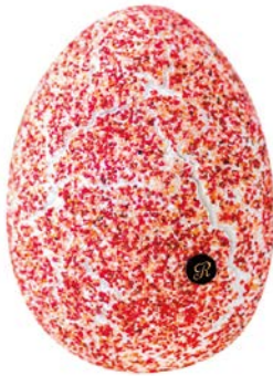
L'ŒUF MERINGUE À LA PRALINE ROSE de François Perret pour l'hôtel Ritz, 68 €