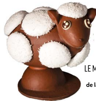
LE MOUTON DU PETIT PRINCE de la Maison Barrelle, 17,50 €