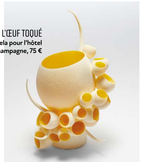
L'ŒUF TOQUÉ de Cédric Servela pour l'hôtel Royal Champagne, 75 €