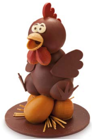
LA POULE de Vincent Guerlais, 26,30 €