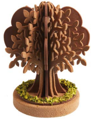
L'ARBRE EN CHOCOLAT VEGAN de la Maison Lenôtre, 55 €