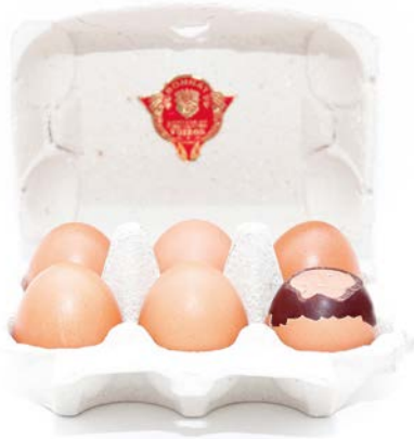
LES ŒUFS COQUILLE FOURRÉS PRALINE de la maison Bonnat, 48 €