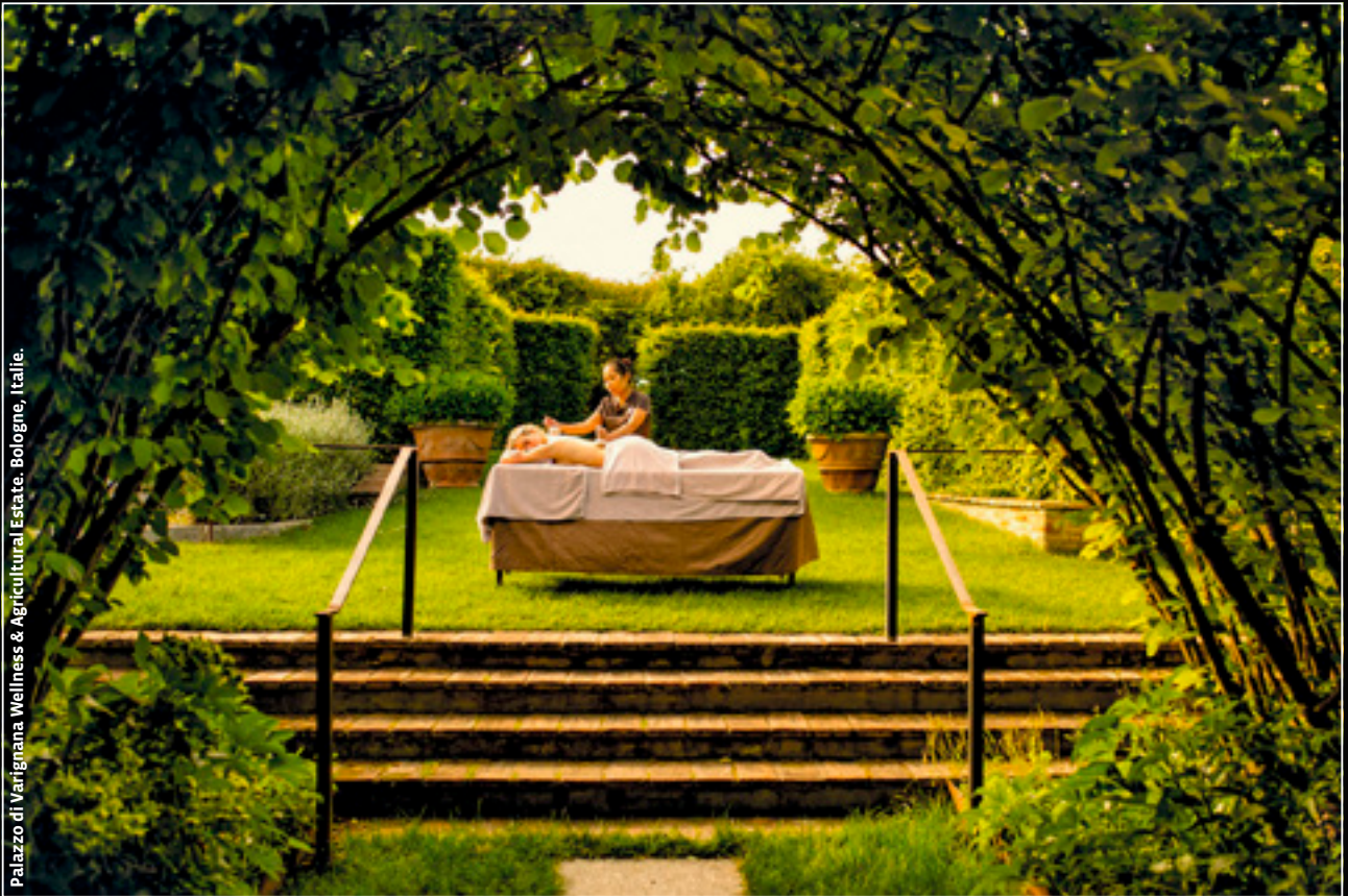
Palazzo di Varignana Wellness & Agricultural Estate. Bologna, Italie.

LE MAGAZINE DES DÉCIDEURS spa | beauté | bien-être | santé