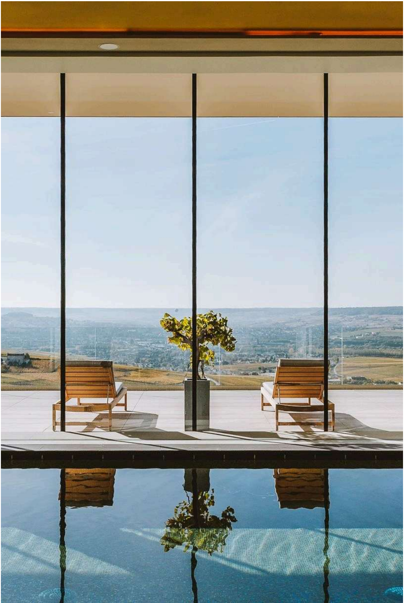
Royal Champagne Hotel & Spa